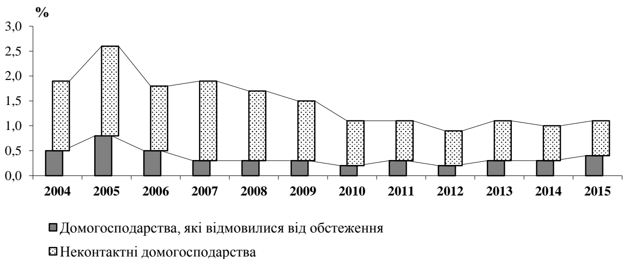
Рис. 2. Частка домогосподарств, які не взяли участь у обстеженні.

Збільшення частки домогосподарств, які взяли участь у обстеженні в 2008 – 2013 роках, відбулося за рахунок зменшення кількості так званих "неконтактних" домогосподарств, тобто домогосподарств, з якими через об'єктивні причини неможливо було встановити контакт, але їхні ресурси (земельні ділянки, господарські будівлі) використовувалися для отримання сільськогосподарської продукції. У 2015 році відсоток домогосподарств, які відмовилися від участі в обстеженні, становив 0,4%, неконтактних домогосподарств – 0,7% (див. рис.2).